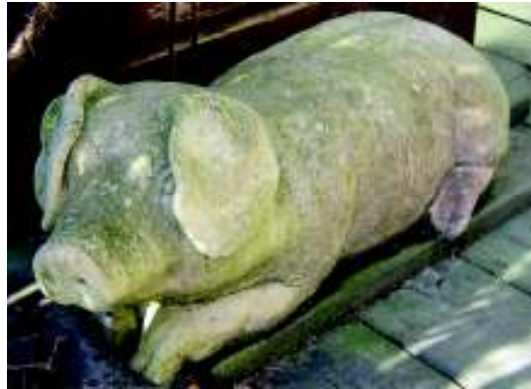
Norra Mon Konstcenter, Charlottenberg, 2010